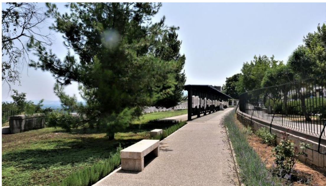
Εικόνα 1. Άποψη της έκθεσης στην αυλή του Αρχαιολογικού Μουσείου Βέροιας

Την έκθεση θα εγκαινιάσει η Υπουργός Πολιτισμού και Αθλητισμού Λίνα Μενδώνη.