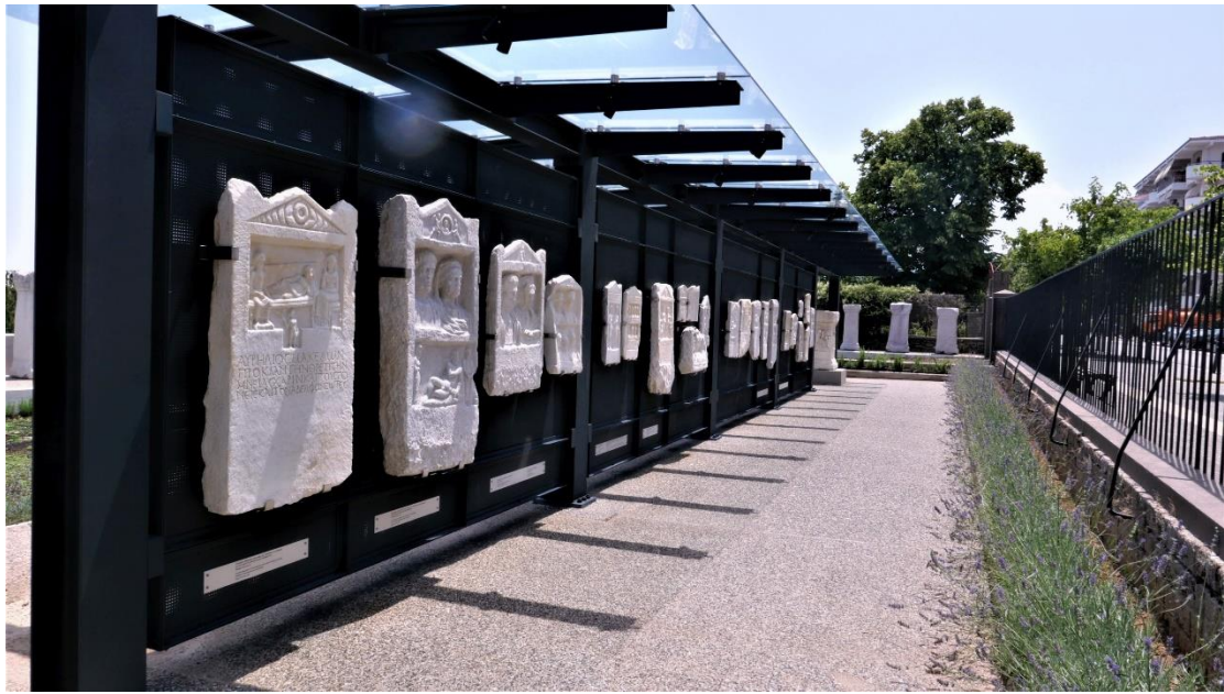
Εικόνα 2. Ο "Τοίχος της Μνήμης"