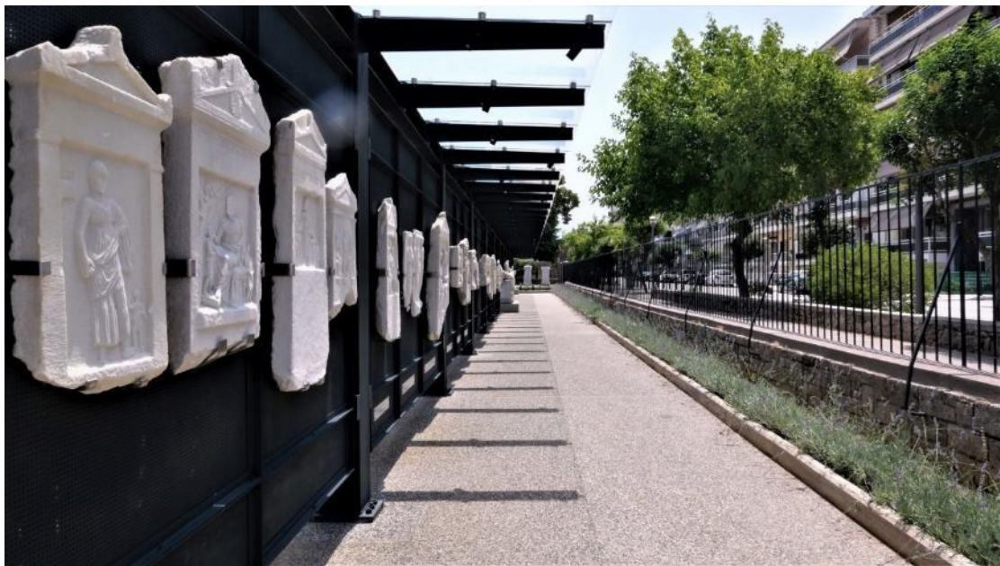
Εικόνα 3. Ο "Τοίχος της Μνήμης"

Συνολικά 190 επιτύμβιες στήλες, επιτύμβιοι και τιμητικοί βωμοί και μαρμάρινες σαρκοφάγοι που χρονολογούνται από τον 4 ο αι. π.Χ. έως τον 4 ο αι. μ.Χ. καθαρίστηκαν, συντηρήθηκαν και αποκαταστάθηκαν αισθητικά και για πρώτη φορά παρουσιάζουν συστηματικά στο ευρύ κοινό την προσωπογραφία, τους θεσμούς και τα ιδεώδη της αρχαίας