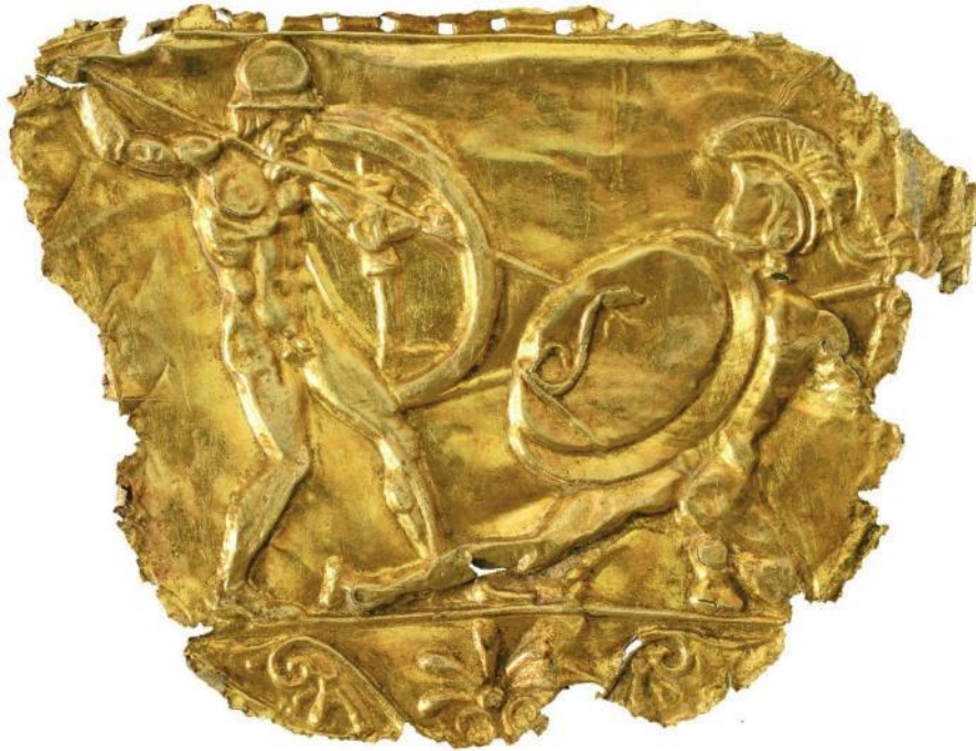
Εικόνα 5. Χρυσό έλασμα από τη βασιλική ασπίδα, περ. 430 π.Χ.

Θα τηρηθούν όλα τα πρωτοκόλλα ασφαλούς προσέλευσης και παραμονής στον χώρο. Παρακαλούνται οι συμμετέχοντες να ακολουθούν τις οδηγίες του προσωπικού της ΕΦΑ Ημαθίας για την κίνησή τους στον χώρο.