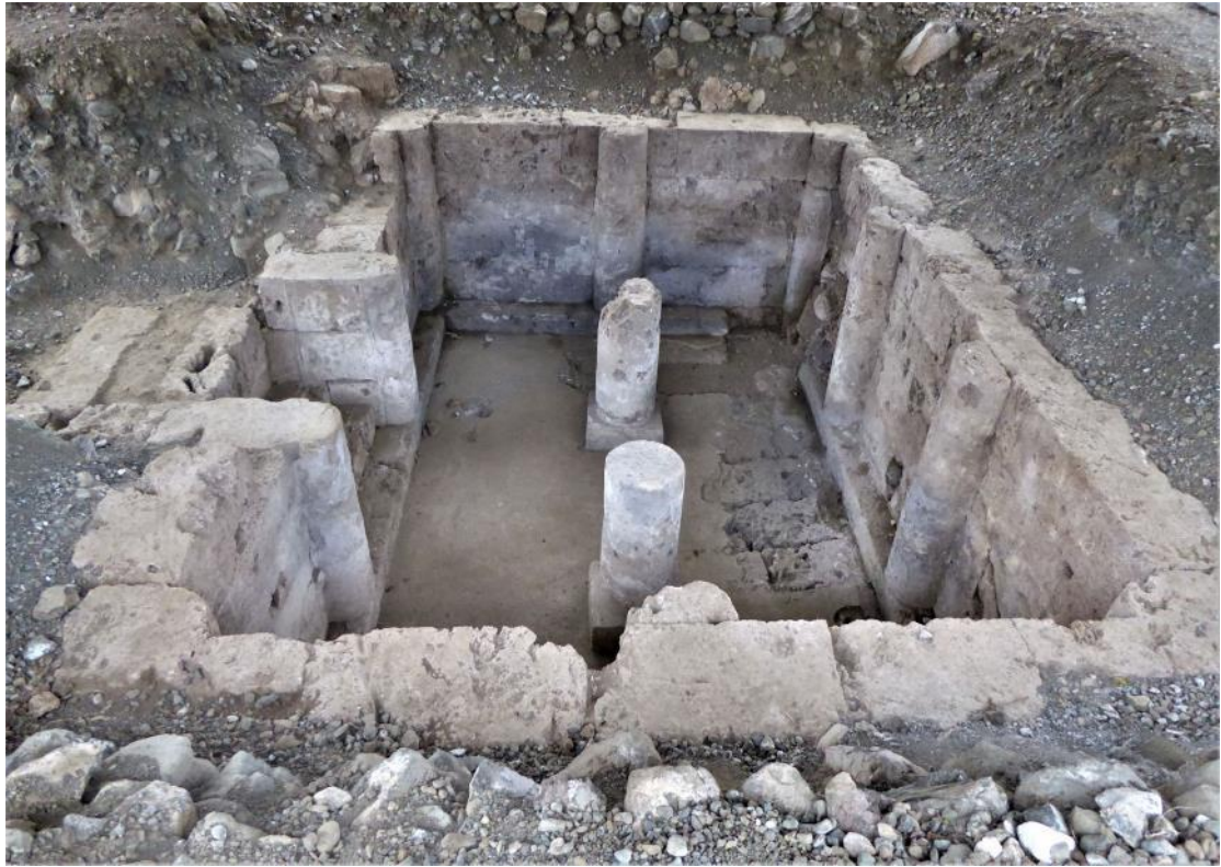
Εικόνα 3. Υπόσπηλος Τάφος του Αλέξανδρου Α', 454 π.Χ. © Υπουργείο Πολιτισμού και Αθλητισμού