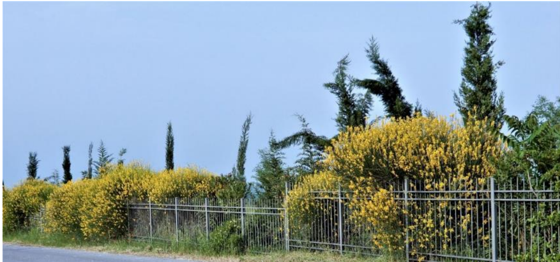
Εικόνα 1. Άποψη Αρχαιολογικού Πάρκου

σε ένα ταξίδι στη μνήμη και την ιστορία και τον προετοιμάζει να συναντηθεί με εκείνους που άλλαξαν την πορεία του κόσμου, τον Φίλιππο Β΄ και τον Μεγαλέξανδρο, που σύμφωνα με τις αρχαίες πηγές ξεκίνησε από δω, από τα ιερά χώματα της βασιλικής Μητρόπολης των Μακεδόνων, την μεγάλη εκστρατεία.