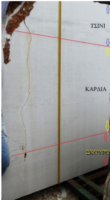
εικ.1: "Σπέσιαλ Κληματιάς"